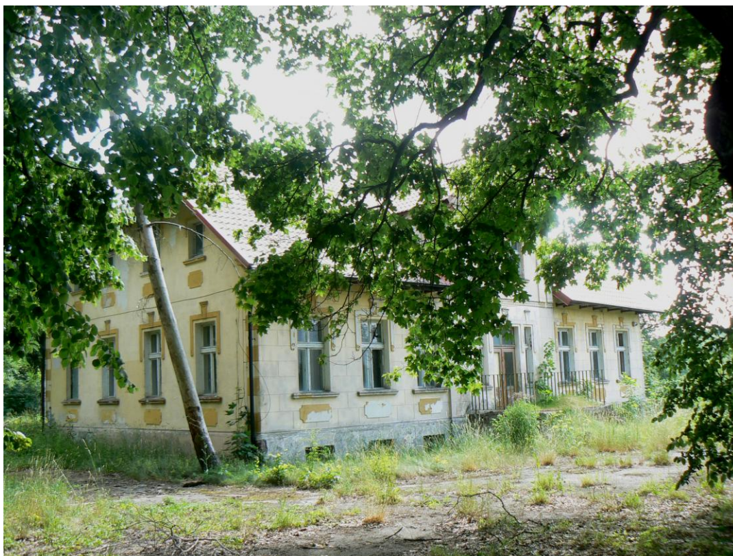
Dwór przy ul. Palińskiego

Na terenie Bożenkowa nie ma zabytków wpisanych do rejestru zabytków, ale zachowały się obiekty objęte ewidencją zabytków. Należy do nich m.in. budynek, w którym mieści się Świetlica Wiejska, dwór przy ul. Palińskiego, budynki przy ul. Grobla. Charakterystycznym obiektem w Bożenkowie prezentowanym w minionych latach w wydawnictwach promocyjnych gminy był młyn wodny, ale budynek niestety spłonął.