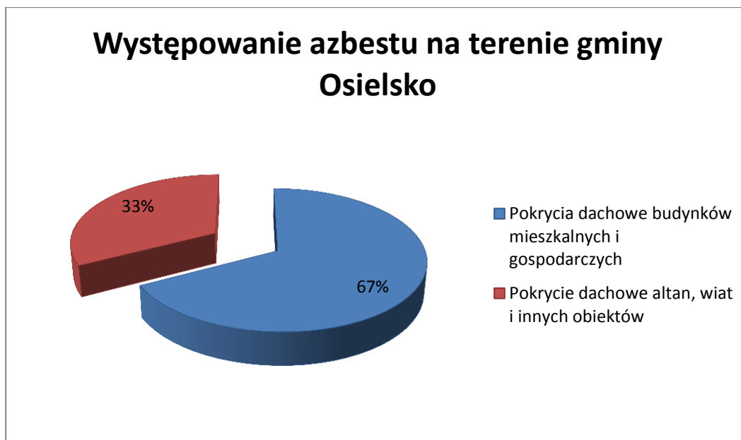
Rysunek 2. Wykres przedstawiający wykorzystanie azbestu na terenie gminy Osiesko

Według Rozporządzenia Ministra Gospodarki, Pracy i Polityki Społecznej z dnia 2 kwietnia 2004 r. w sprawie sposobów i warunków bezpiecznego użytkowania i usuwania wyrobów zawierających azbest (Dz. U. z 2004 r. Nr 71, poz. 649 ze zm.) właściciel, użytkownik wieczysty lub zarządca nieruchomości, obiektu, instalacji, urządzenia lub innego miejsca zawierającego azbest, zobowiązany jest do przeprowadzania kontroli stanu tych wyrobów w terminach wynikającym z oceny stanu tych wyrobów. Ocena ta ma na celu określenie stopnia pilności usunięcia wyrobu zawierającego azbest. W rozporządzeniu wyróżniono trzy stopnie pilności. W przypadku stwierdzenia I stopnia pilności wymagane jest pilne usunięcie, czyli wymiana na wyrób bezazbestowy lub zabezpieczenie tego wyrobu. II stopień pilności zobowiązuje do wykonania ponownej oceny w terminie do 1 roku. III stopień pilności wymaga wykonania ponownej oceny w terminie do 5 lat.