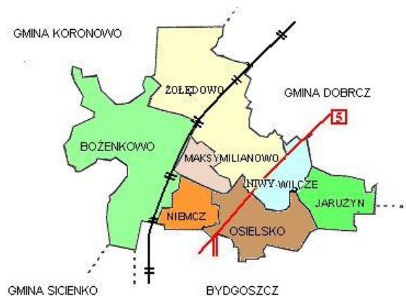
Rysunek 1. Mapa Gminy Osielsko z podziałem na sołectwa