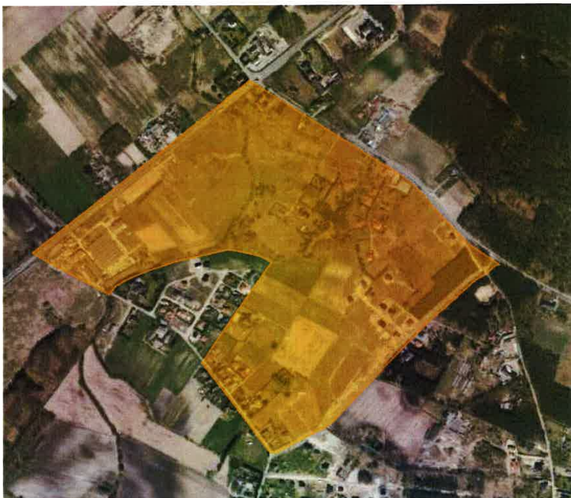
Charakter zagospodarowania analizowanego terenu

Analizowany obszar o powierzchni około 52 ha, położony jest w środkowej części gminy Osielsko, w północnej części miejscowości Niwy. Teren posiada regularny kształt, ograniczony z każdej strony drogami ul. Krakowska (od północy), ul. Zakopiańska (od wschodu), ul. Karpacka (od południa), Szosa Gdańska – droga krajowa (od zachodu). Rozciągłość terenu ze wschodu na zachód wynosi około 1,15 km, a z północy na południe około 1,0 km. Większą część terenu opracowania stanowią tereny niezabudowane – nieużytki rolne. Tereny przemysłowe i usługowe znajdują się w południowo – zachodniej części analizowanego terenu, przy drodze krajowej, m.in. Zajazd pod Grzybkiem, Motel na Niwach, hurtownia skór meblowych. Zabudowa mieszkaniowo – usługowa rozwinęła się wzdłuż ulicy Krakowskiej, zabudowa mieszkaniowa jednorodzinna występuje wzdłuż ulicy Karpackiej oraz wzdłuż drogi dojazdowej od ulicy Krakowskiej. Na analizowanym obszarze znajdują się liczne zadrzewienia, głównie wzdłuż rowu melioracyjnego. Teren leśny znajduje się na północno – wschodnim skraju analizowanego obszaru – dwa zagajniki z przewagą drzew liściastych.