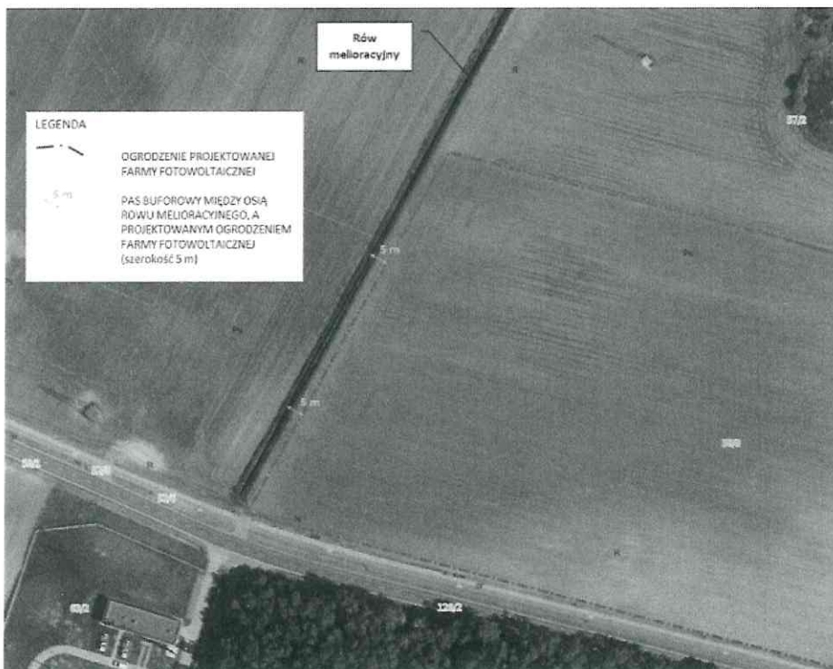
Rysunek 3. Odsunięcie przedsięwzięcia od rowu melioracyjnego po stronie zachodniej, zgodnie z uzupełnieniem Kip z dnia 01.08.2023 r. (wpływ: 02.08.2023 r.).